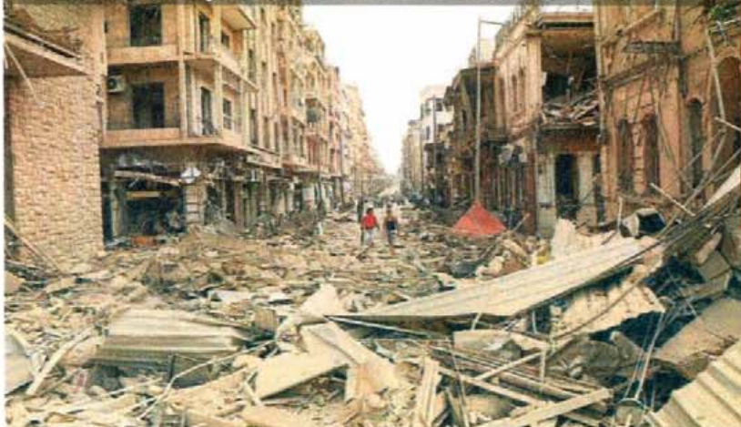
► Ataque múltiple con autos bomba tuvo lugar en Aleppo, la segunda ciudad más importante de Siria.