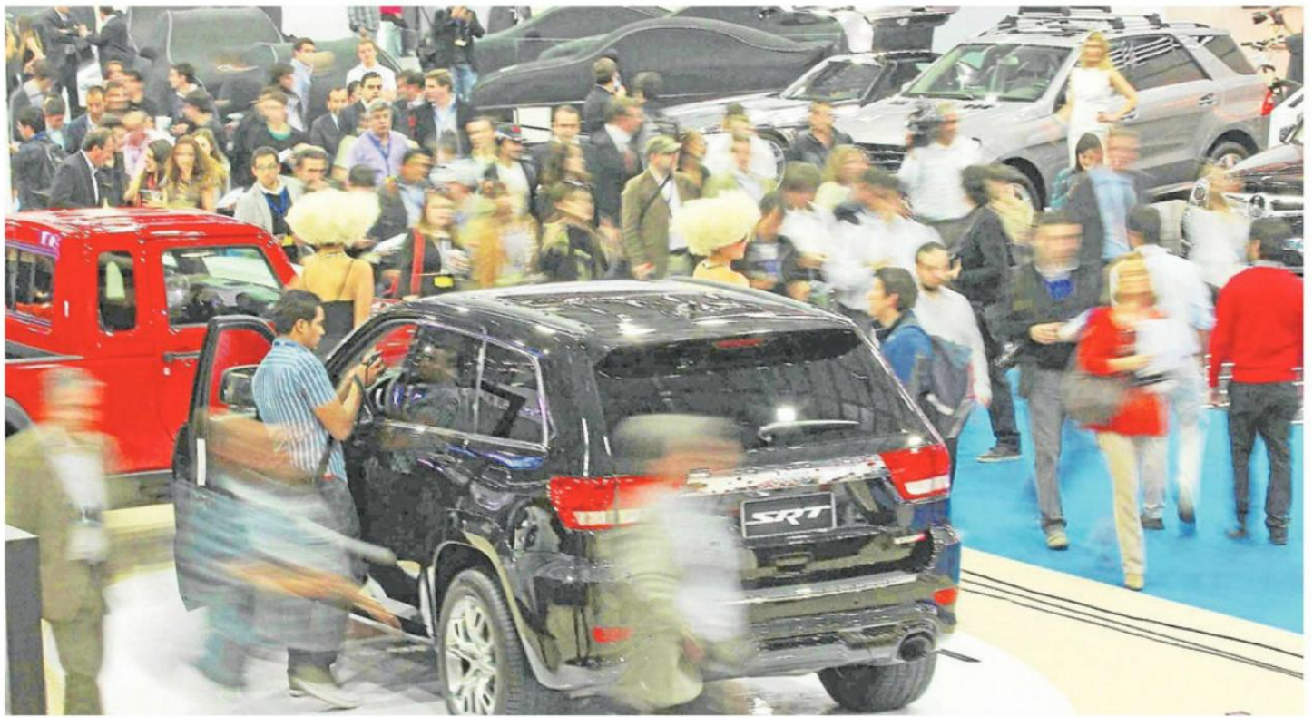
► La duodécima versión se realiza en el Espacio Riesco desde hoy y hasta el 15 de octubre.

Escanea este código y revisa las novedades que trae el Salón del Automóvil de Santiago