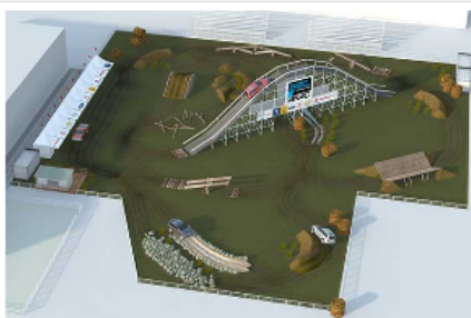
Pista Off Road

Para los más grandes, en tanto, habrá una pista de dos circuitos para demonstraciones de vehículos off road (4x4 y 4x2), en las cuales el público podrá experimentar de la mano de un piloto experto las pruebas que desafiarán las potencialidades de los vehículos todoterreno. La pista contará con una rampla de siete metros, balancín doble, cruce de palos, dubbies de madera y tierra, sector de piedra y arena, plano inclinado MV, pendiente lateral de tierra, entre otros desafíos.