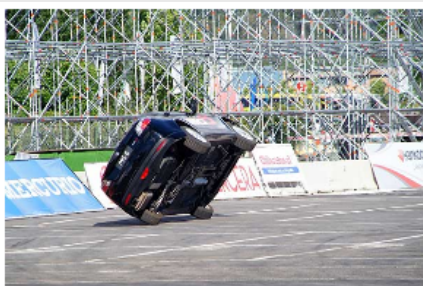
El británico Russ Swift