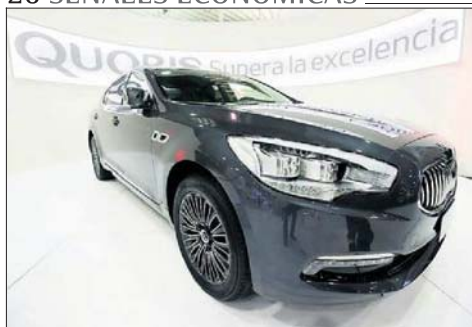
El Quoris de Kia apunta a competir con BMW y Mercedes.