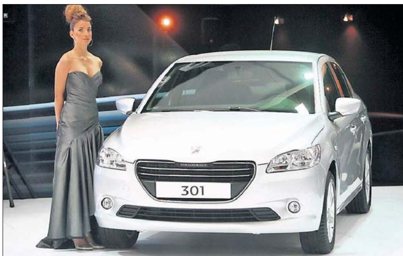
El Peugeot 301 tendría un valor cercano a los $ 9 millones cuando llegue al país en enero de 2013.

En el caso de Kia, el Cerato estrenará la nueva imagen de la marca y hace su debut mundial en el salón. Según el gerente general de Kia