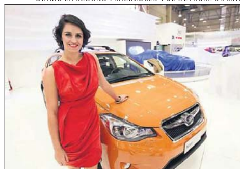
Fernanda Urrejola, rostro de Subaru, es una de las múltiples caras "famosas" de las marcas.