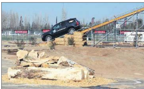
La pista "off road" llevará a los asistentes con un piloto experto por pruebas para los vehículos todoterreno.