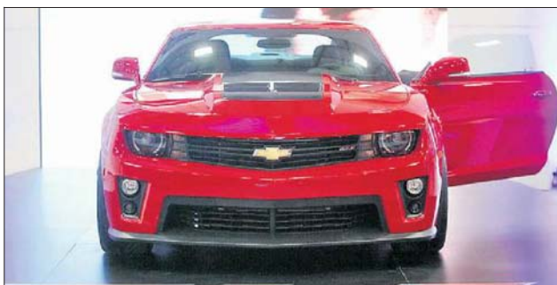
El nuevo Chevrolet Camaro ZL1 es una edición de lujo con 580 HP, y un valor superior a $ 30 millones. Esperan vender dos al mes.