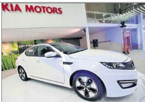
La versión híbrida de Kia Optima es el primero de este tipo para la marca.