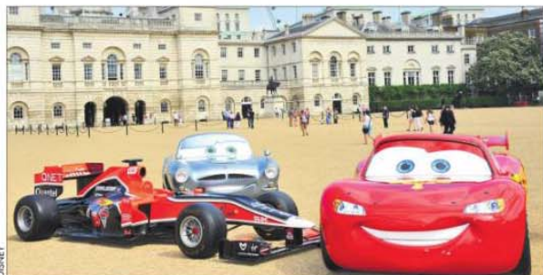
Los autitos de Disney-Pixar estarán en la alfombra roja.