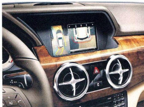
Parktronic de Mercedes te dice si cabe o no cabe el auto.

Panda, que incorpora el "Indicador de cambio de marcha" (GSI), una especie de copiloto que le sugiere al conductor cuando pasar el cambio y así reducir los consumos del auto. Una muestra del futuro la pone el concepto de Hyundai HCD12 Curb, que busca llevar a la práctica la conectividad total. Para subirse al modelo, simplemente se debe arrastrar el dedo a través de un panel táctil no visible.