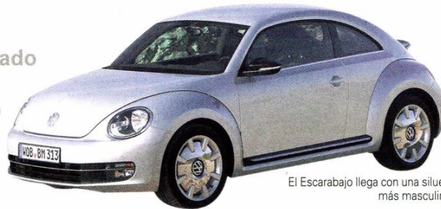
El Escarabajo llega con una silueta más masculina.

Más dinámica, provocadora, potente y deportiva llega la nueva generación del icónico Volkswagen Beetle. Además de incorporar tecnología de punta, en cuanto a seguridad y confort, el modelo ofrece como opcional el exclusivo sistema de audio Fender.