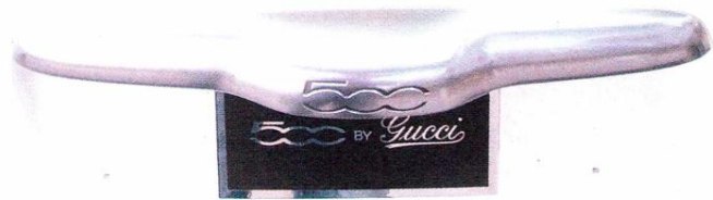
Estiloso hasta decir basta es el Fiat 500 by Gucci.