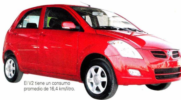
El V2 tiene un consumo promedio de 16,4 km/litro.