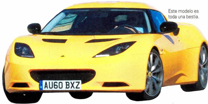
Este modelo es toda una bestia.

Ya se prendieron los motores de la principal muestra de la industria automotriz, con la inauguración del XII Salón del Automóvil de Santiago, que llega con novedades para los gustos de grandes y chicos. Más amplio que la edición pasada, el evento -que espera atraer a más de 170 mil visitantes- va a reunir a más de 300 modelos de vehículos, de 54 marcas y 22 orígenes diferentes. Entre las primicias incluso se encuentran estrenos mundiales, como es el caso del Kia Cerato. Pero no todo será lanzamientos y novedades, ya que el Salón del Automóvil también está pensado para disfrutar con toda la familia. Para entretener a los más chicos, y a los niños de corazón, los personajes de la película Cars, también están invitados a la fiesta motor. Así, todos los asistentes al evento se podrán fotografiar con El Rayo McQueen, su amigo Mate y el sofisticado agente secreto, Finn McMissile. La nota de adrenalina la dará el experto en manejo extremo, Russ Swift, que viene a encantar a todos con sus piruetas que lo hicieron conocido mundialmente, como manejar un auto de costado sobre dos ruedas. El público podrá también participar en la pista off road, que tendrá demostraciones del poder de la tracción de los vehículos todoterreno.