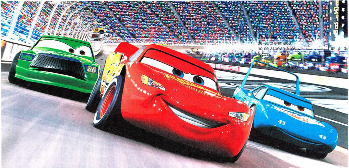
Un detalle de los ojos del auto animado no se asocian a los focos.

Llega en tamaño real junto a Mate y Finn McMissile